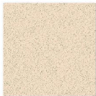
HG 4004 400mm x 400mm