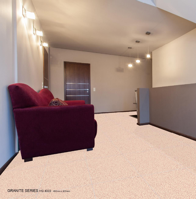
GRANITE SERIES HG 4003 400mm x 400mm