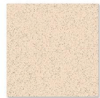
HP 6001 600mm x 600mm