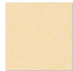
HP 6002 600mm x 600mm