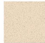
HP 6004 600mm x 600mm