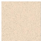
HG 4001 400mm x 400mm