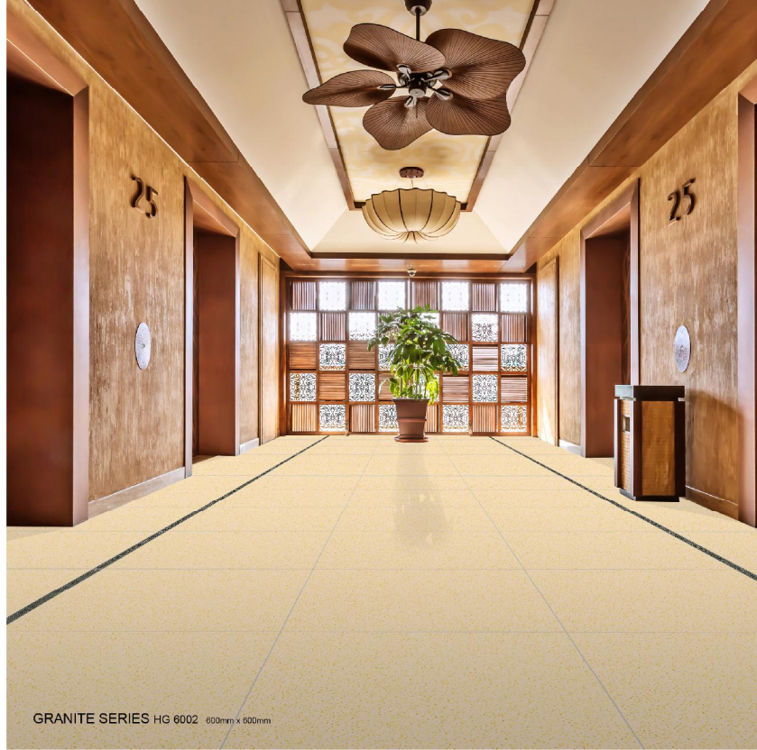
GRANITE SERIES HG 6002 600mm x 600mm