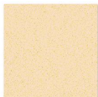
HG 4002 400mm x 400mm