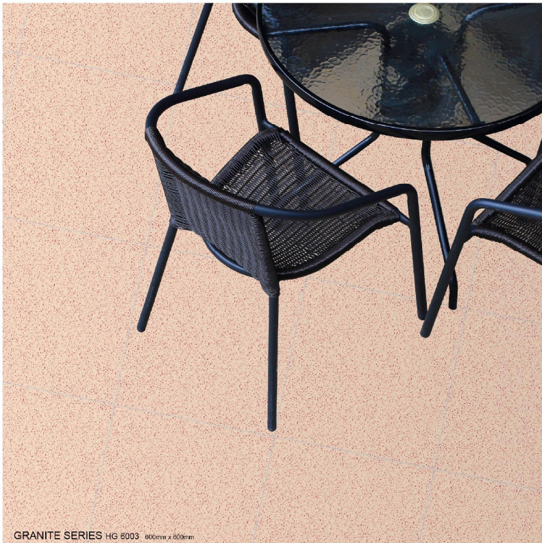
GRANITE SERIES HG 6003 600mm x 600mm