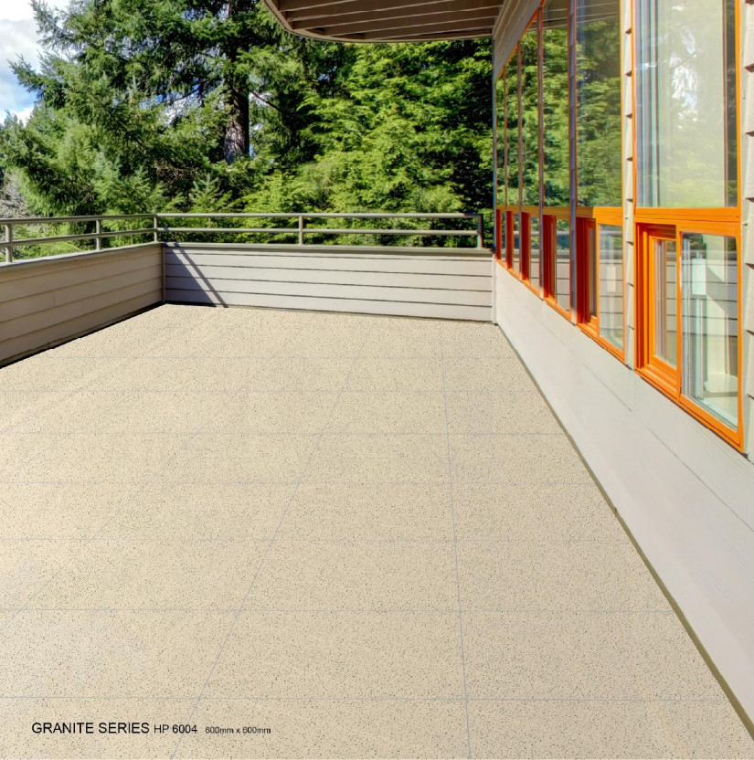
GRANITE SERIES HP 6004 600mm x 600mm