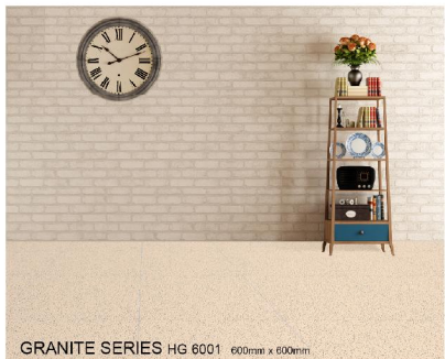
GRANITE SERIES HG 6001 600mm x 600mm