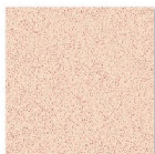
HG 4003 400mm x 400mm