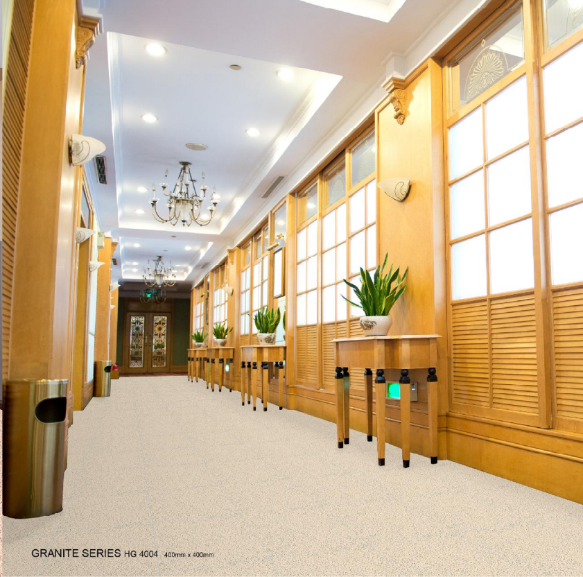
GRANITE SERIES HG 4004 400mm x 400mm