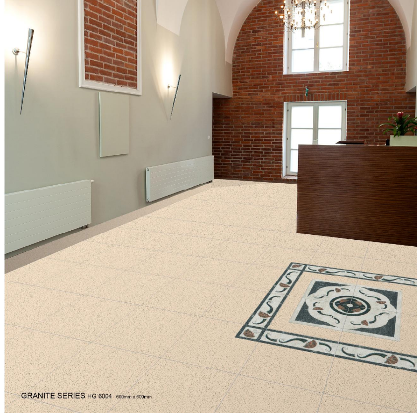
GRANITE SERIES HG 6004 600mm x 600mm