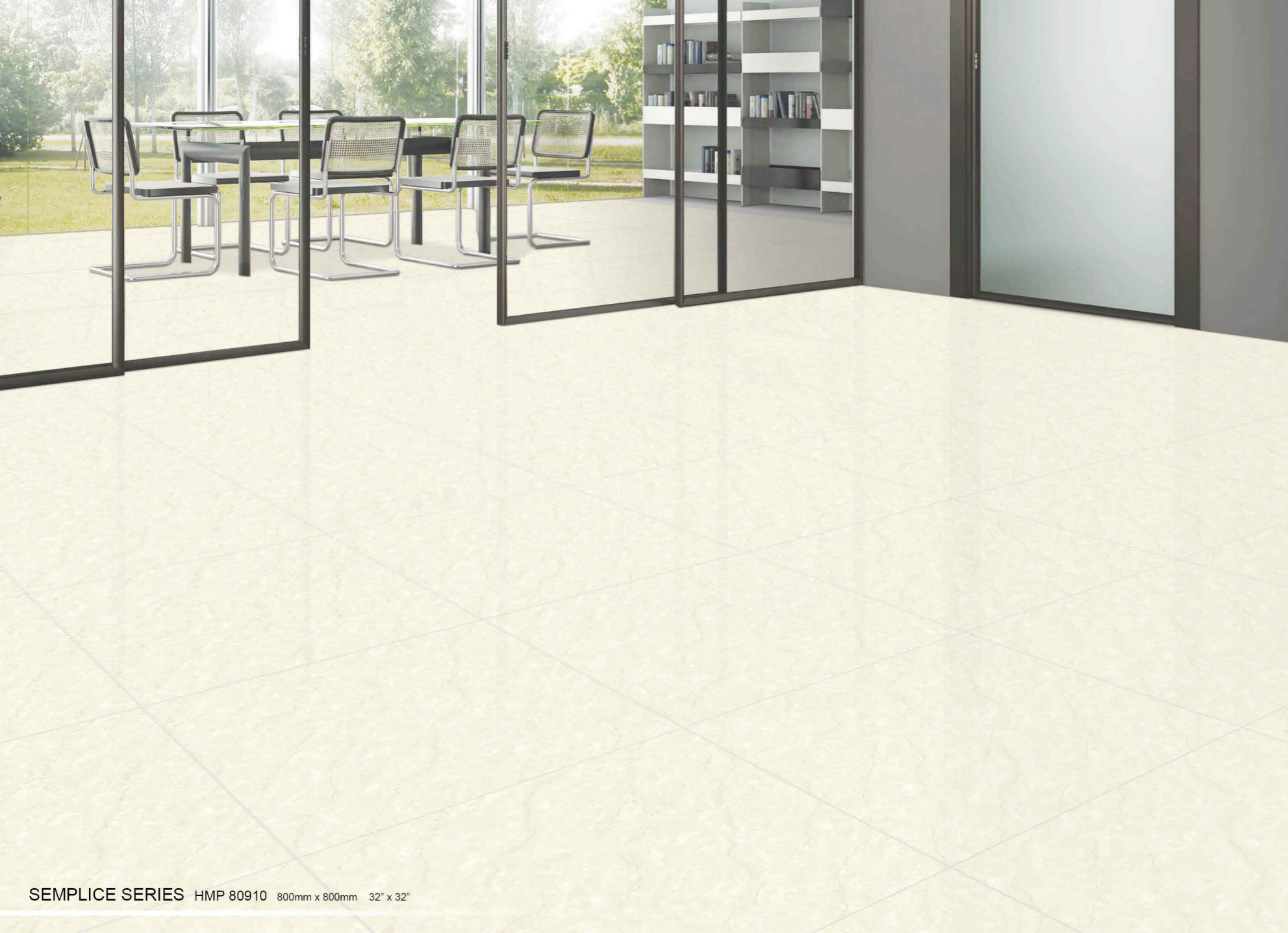
SEMPLICE SERIES HMP 80910 800mm x 800mm 32" x 32"