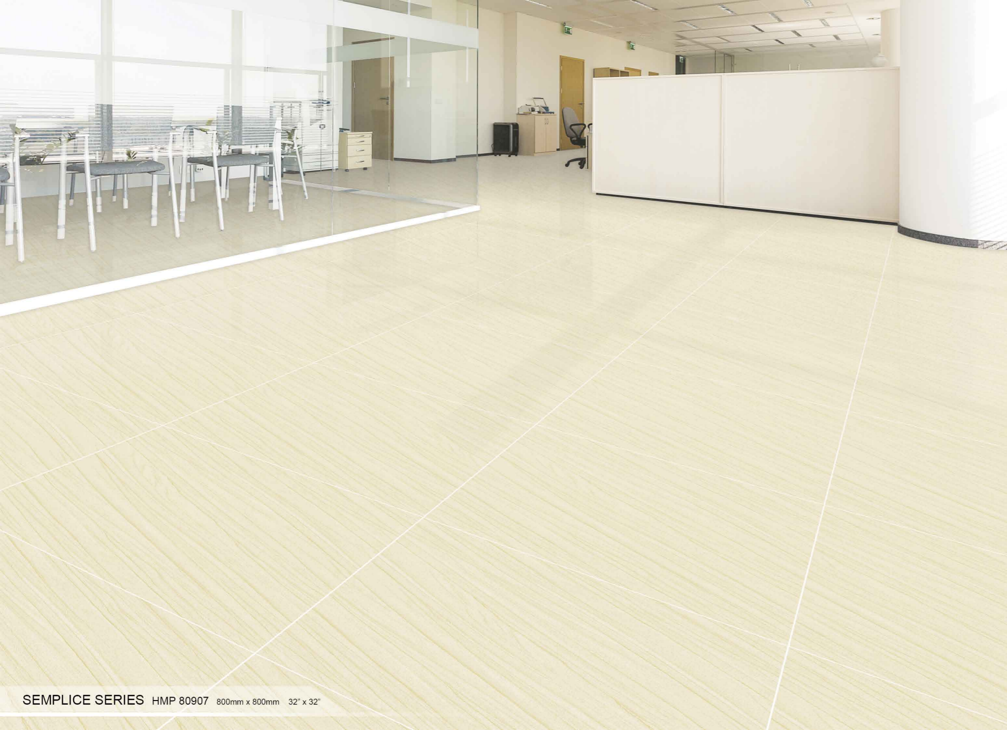
SEMPlice SERIES HMP 80907 800mm x 800mm 32" x 32"