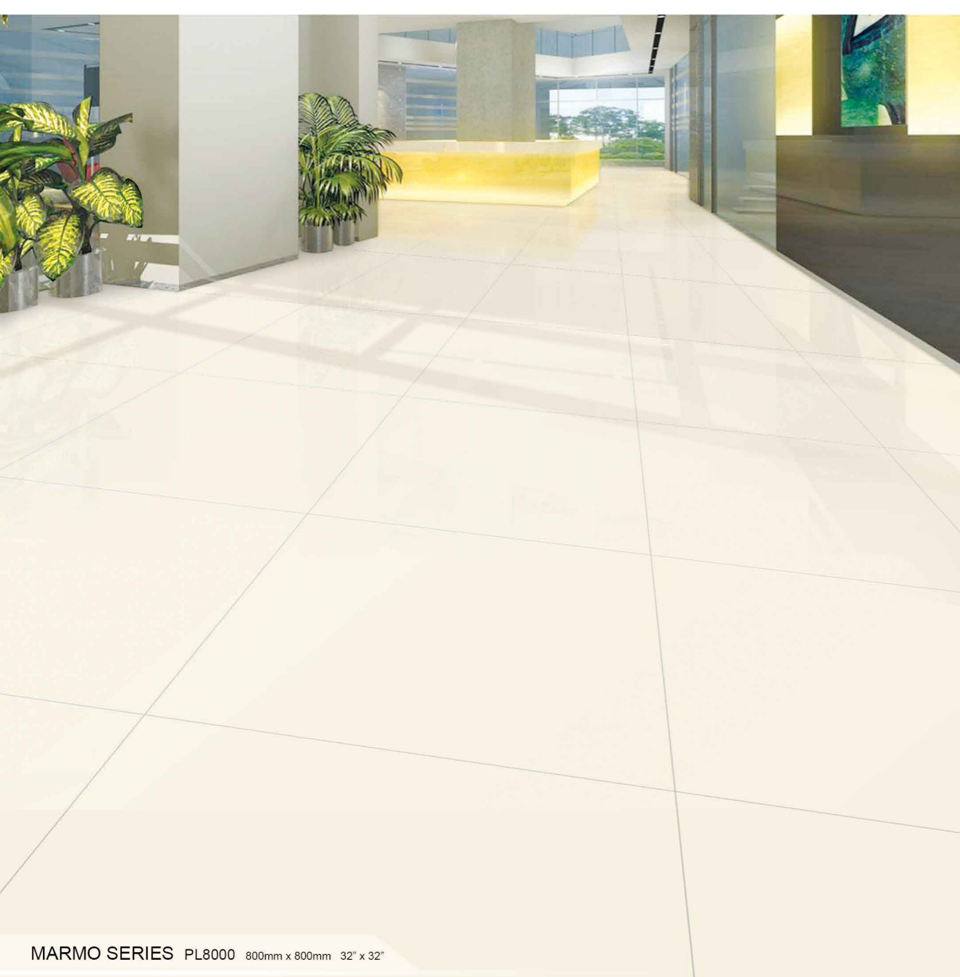
MARMO SERIES PL8000 800mm x 800mm 32" x 32"