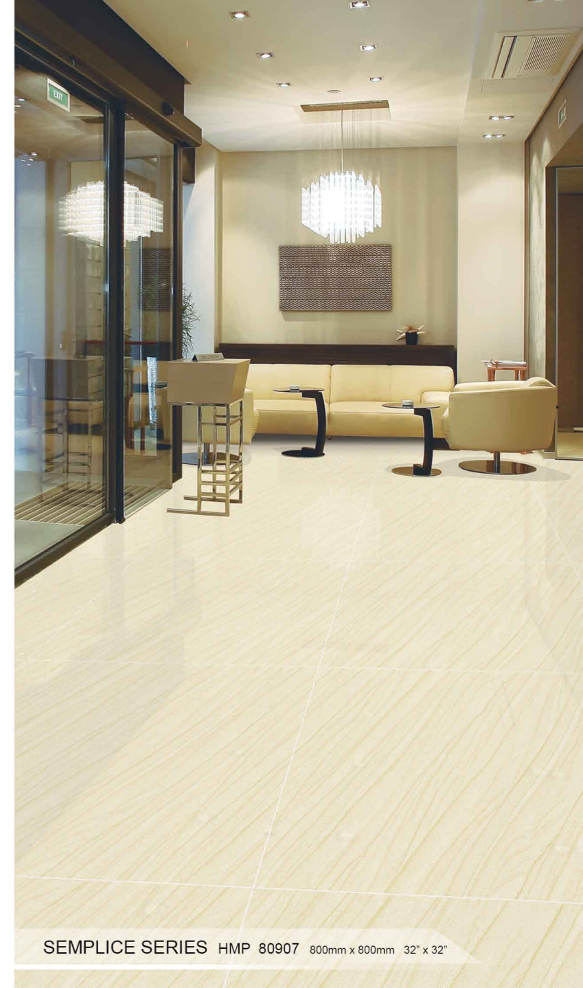
SEMPlice SERIES HMP 80907 800mm x 800mm 32" x 32"