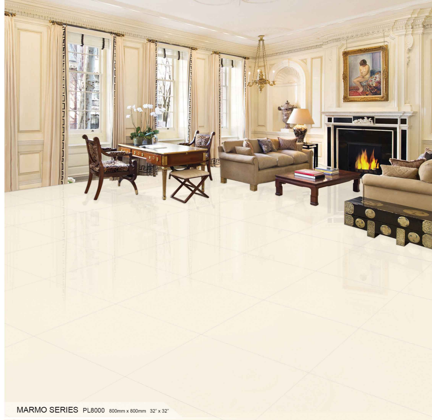
MARMO SERIES PL8000 800mm x 800mm 32" x 32"