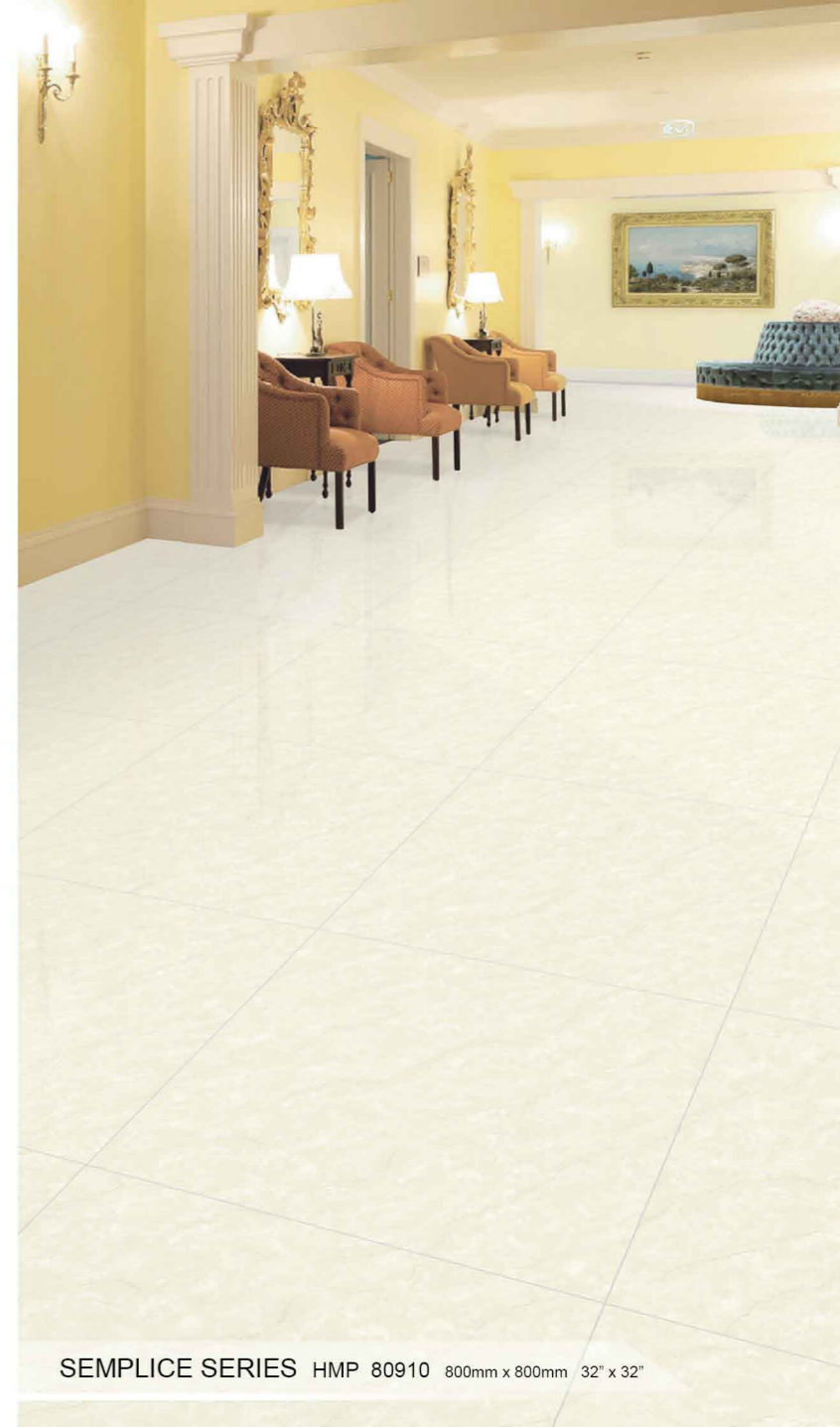
SEMPLICE SERIES HMP 80910 800mm x 800mm 32" x 32"