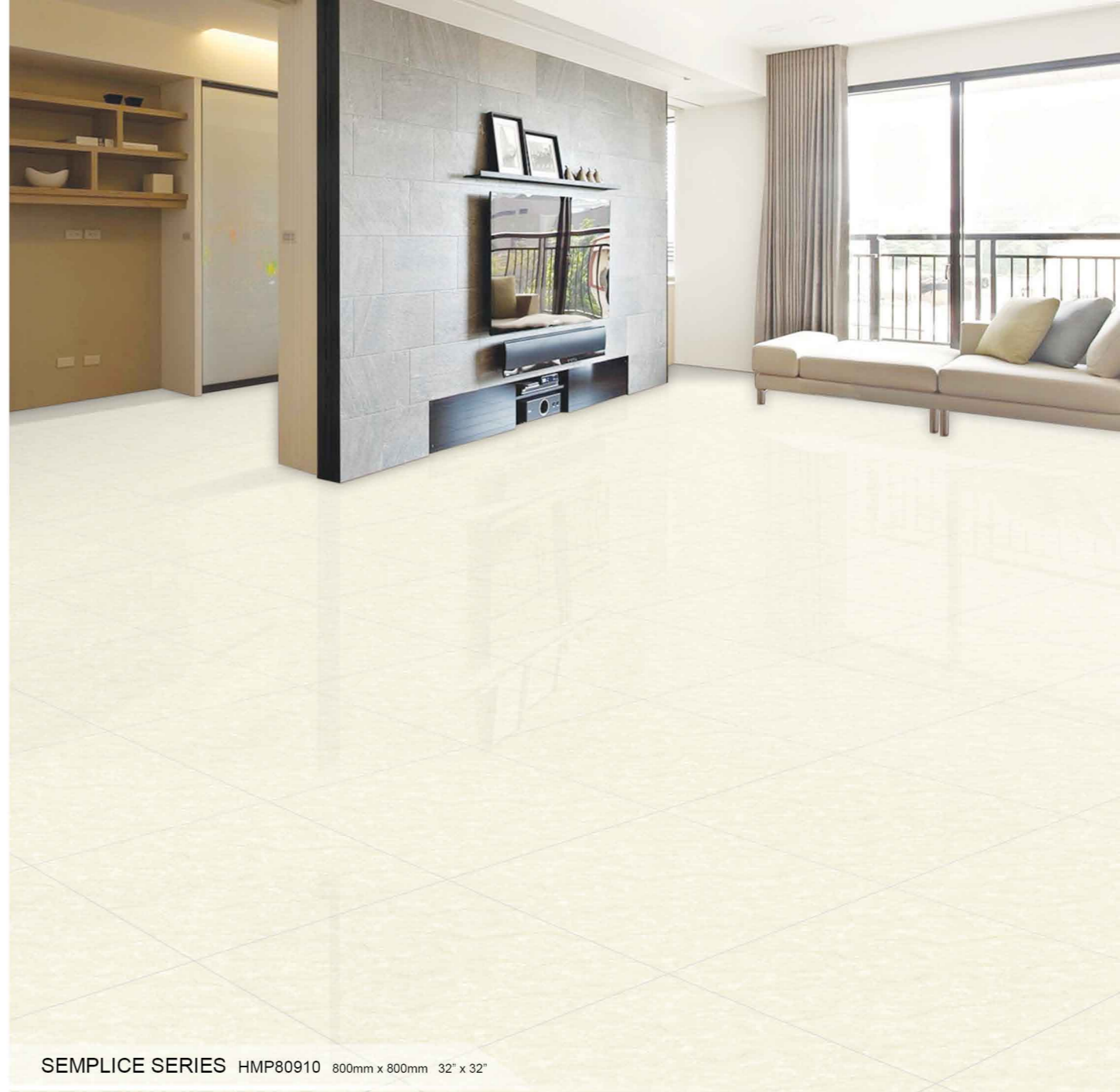
SEMPLICE SERIES HMP80910 800mm x 800mm 32" x 32"