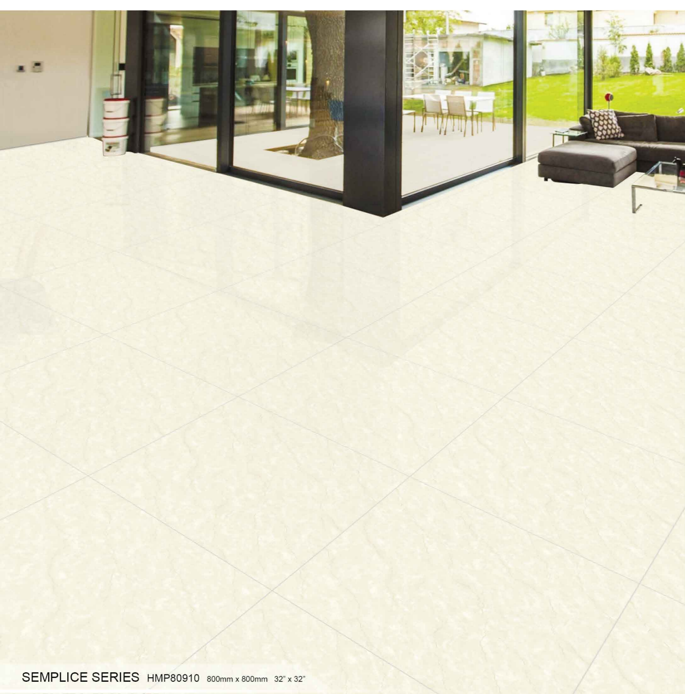
SEMPLICE SERIES HMP80910 800mm x 800mm 32" x 32"