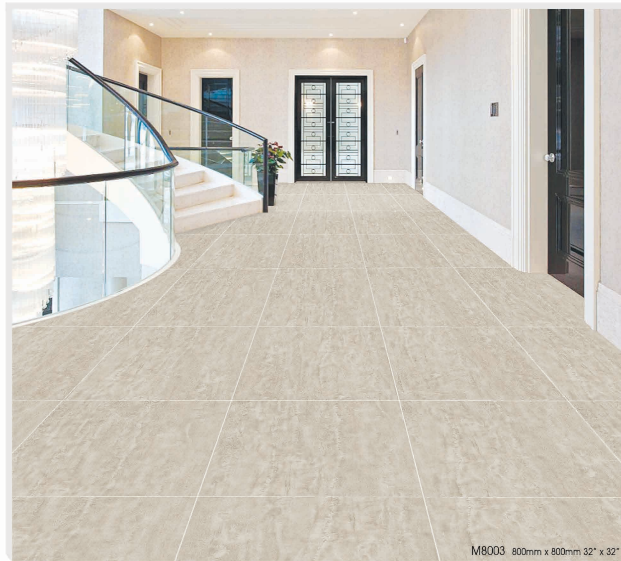
M8003 800mm x 800mm 32" x 32"

WHITE HORSE DIGITAL Inkjet Printing Technology Porcelain Floor V3