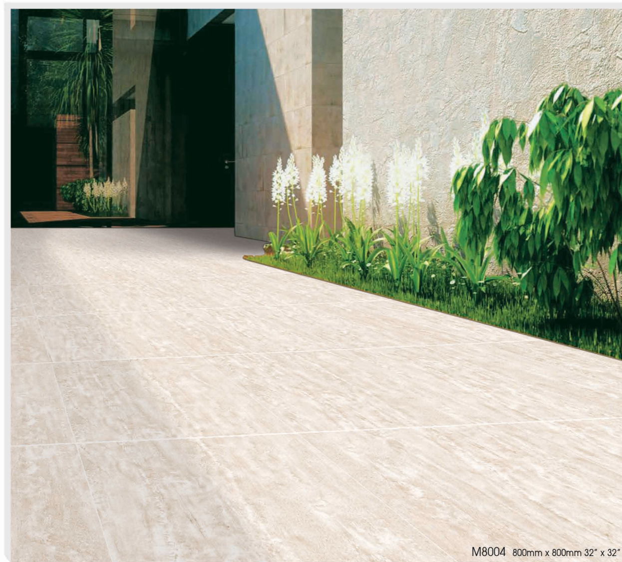
M8004 800mm x 800mm 32" x 32"

WHITE HORSE DIGITAL Inkjet Printing Technology Porcelain Floor V3