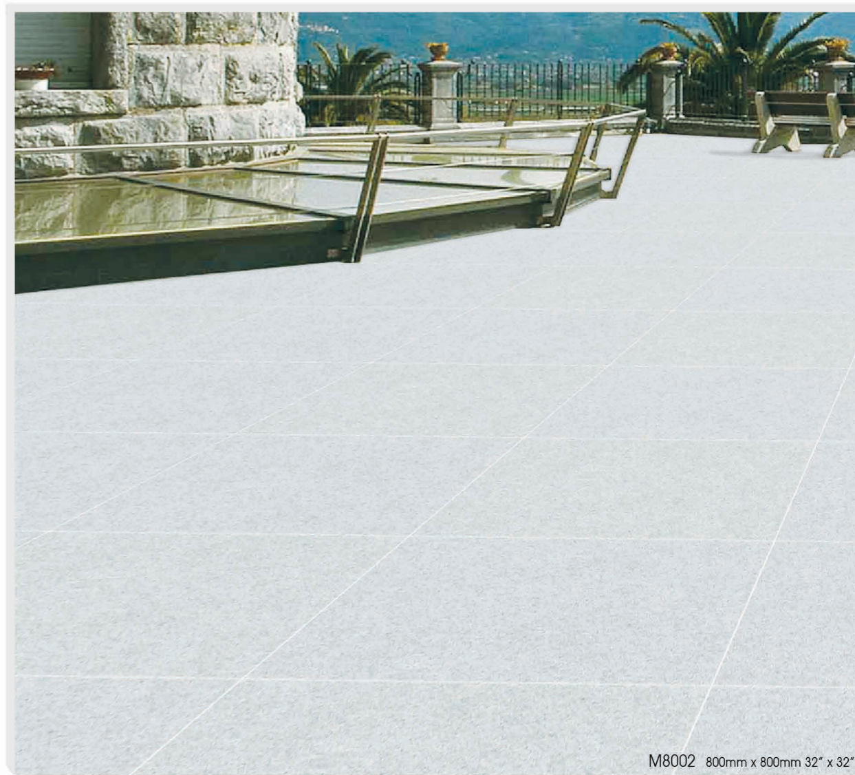
M8002 800mm x 800mm 32" x 32"

WHITE HORSE DIGITAL Inkjet Printing Technology Porcelain Floor V3