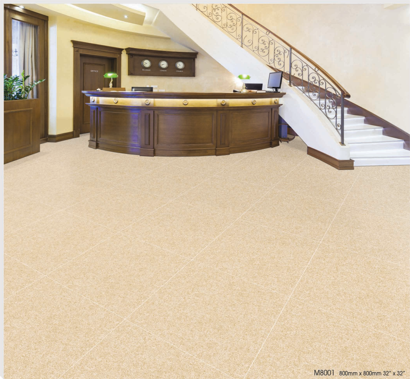
M8001 800mm x 800mm 32" x 32"