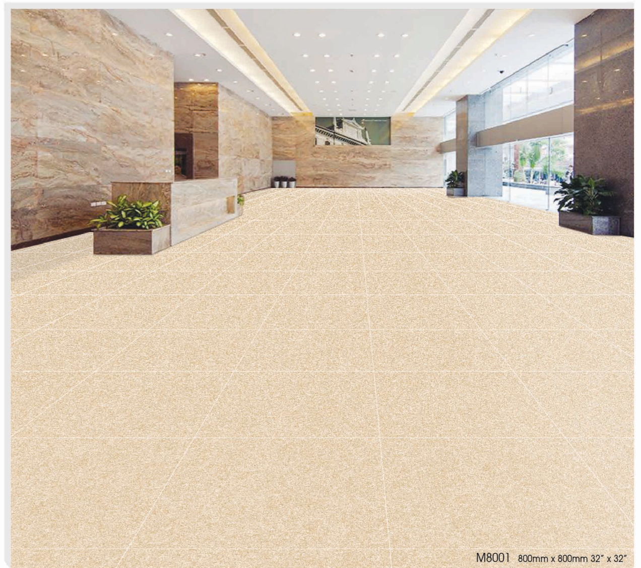
M8001 800mm x 800mm 32" x 32"

WHITE HORSE DIGITAL Inkjet Printing Technology Porcelain Floor V3