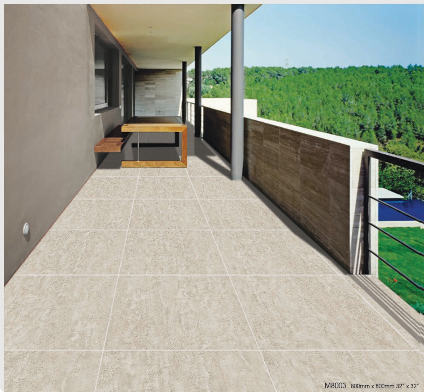
M8003 800mm x 800mm 32" x 32"