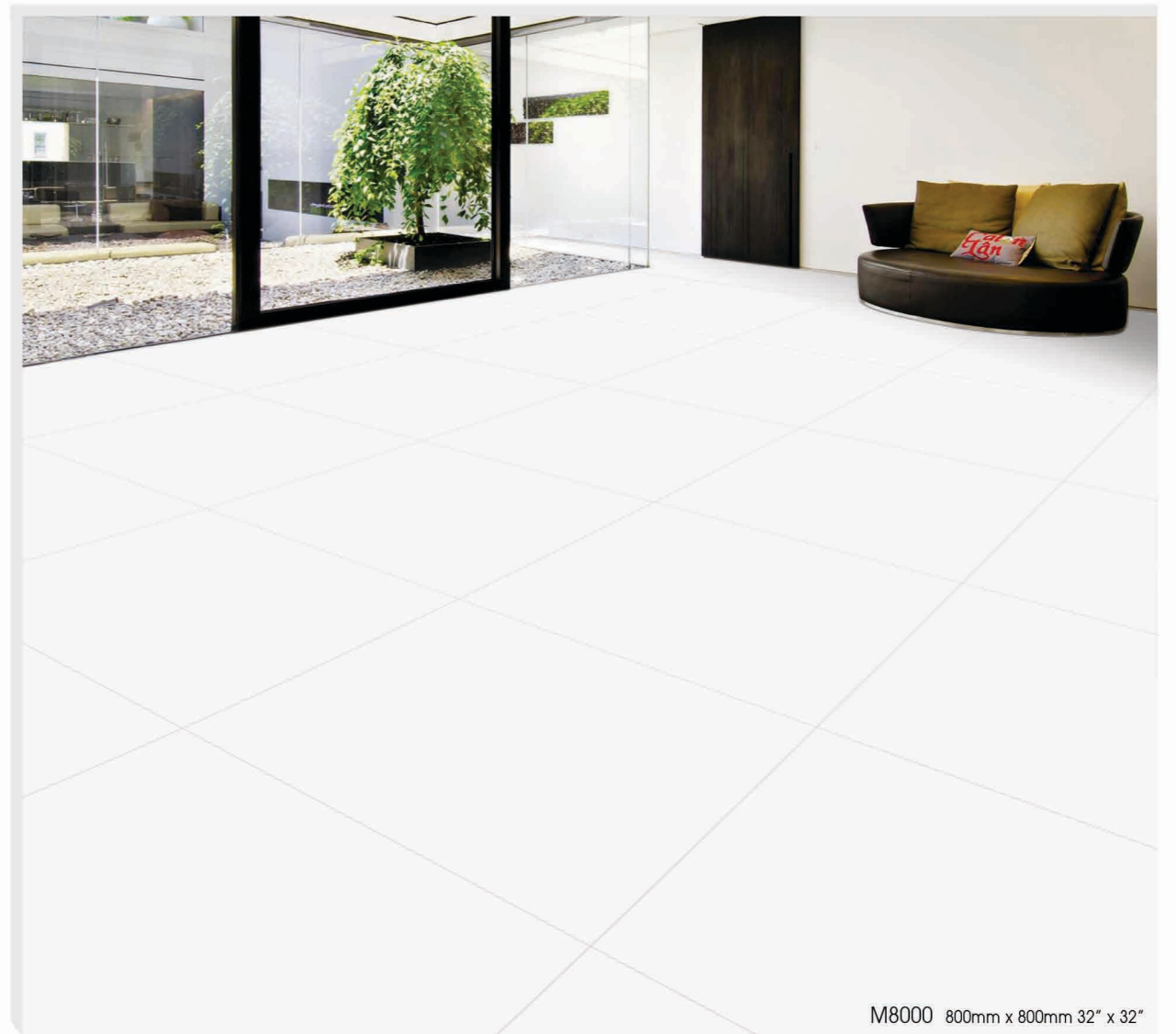
M8000 800mm x 800mm 32" x 32"