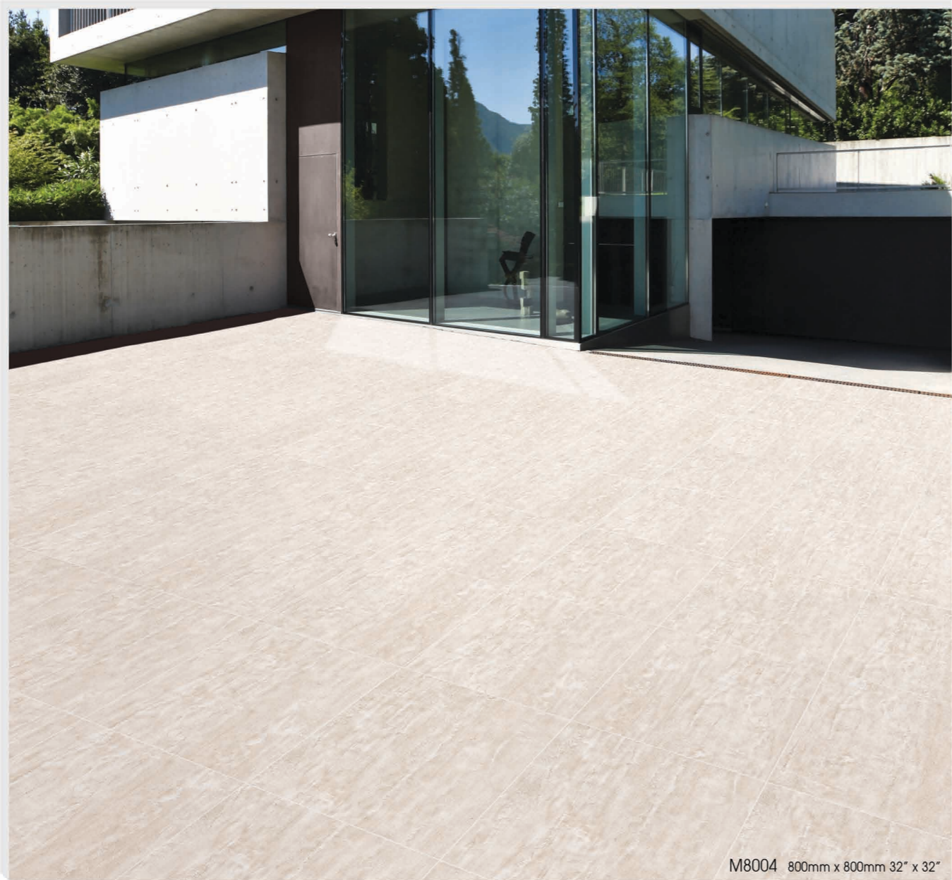
M8004 800mm x 800mm 32" x 32"