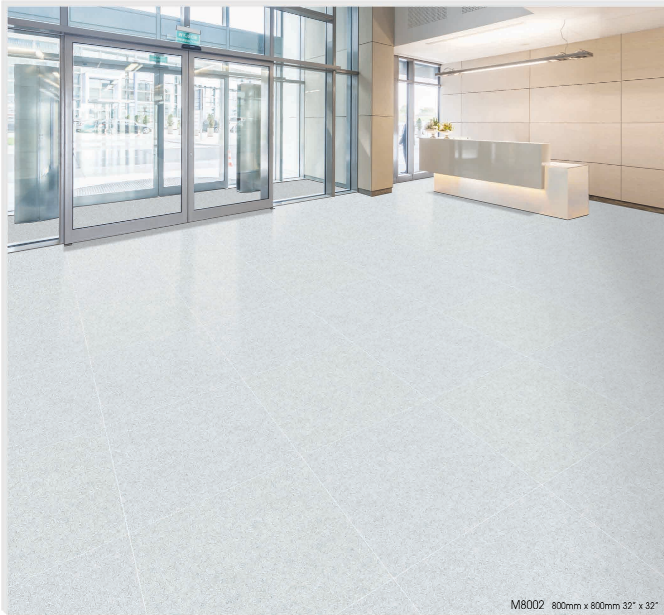
M8002 800mm x 800mm 32" x 32"