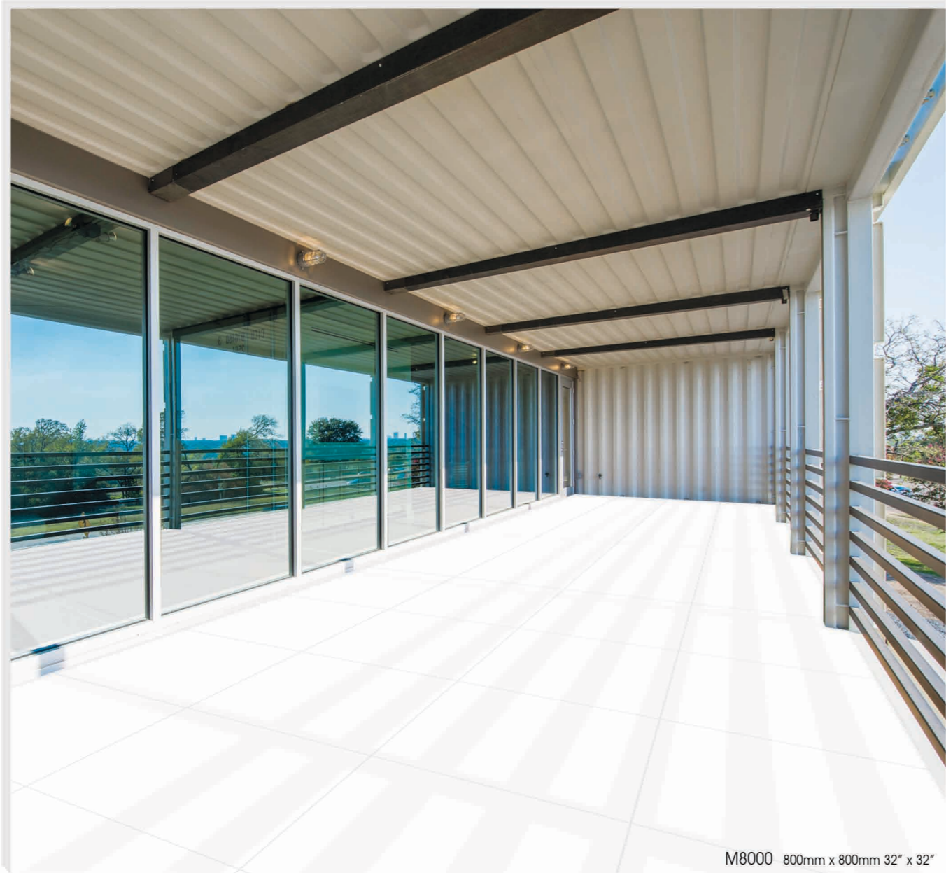
M8000 800mm x 800mm 32" x 32"