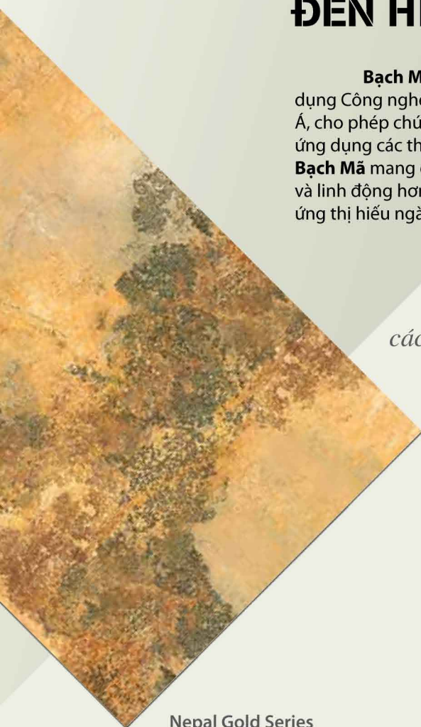
Nepal Gold Series

White Horse also pioneers the introduction of Digital Inkjet Printing Technology in South East Asia enabling us to create, modify, transmit and apply designs directly onto the tile. Ultimately, White Horse provides further creativity, innovation and flexibility in tile design to meet higher consumer expectations.